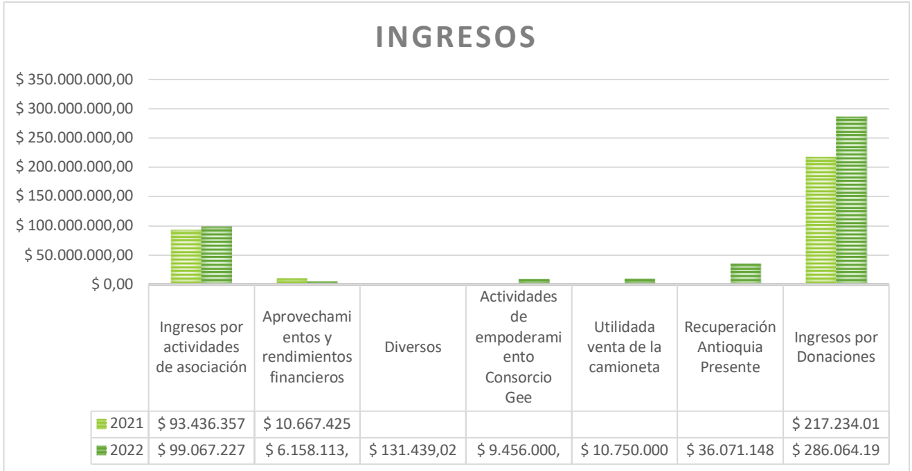
Tabla 3: Ingresos 2022

Durante la vigencia de 2022 se cumplieron con las declaraciones tributarias de retención en la fuente, renta, y se obtuvo la calificación como ESAL.